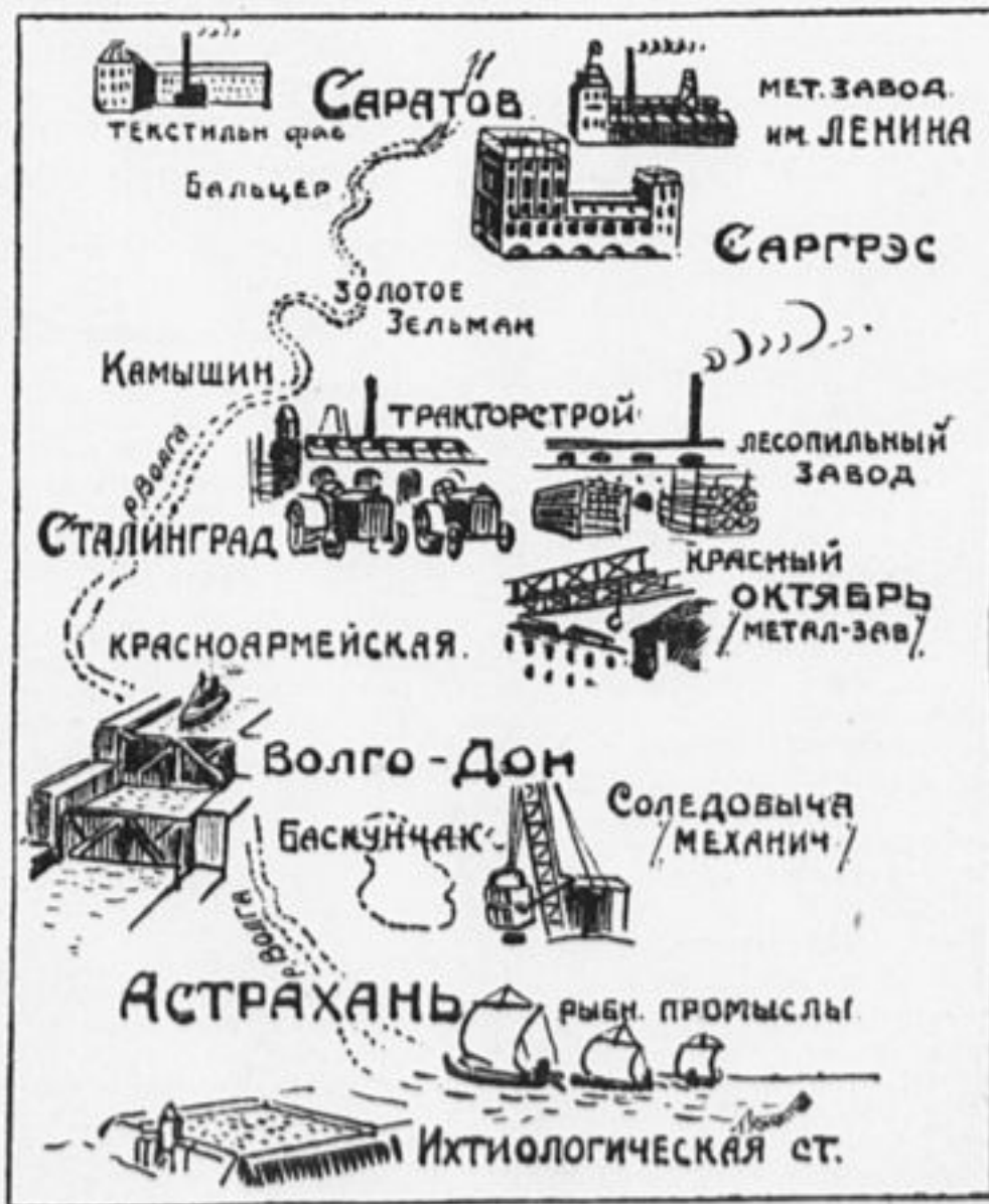
Карта № 1. Что увидит промышленная группа.

Около Красноармейска советский инженер и рабочий будут изменять географию — заставят