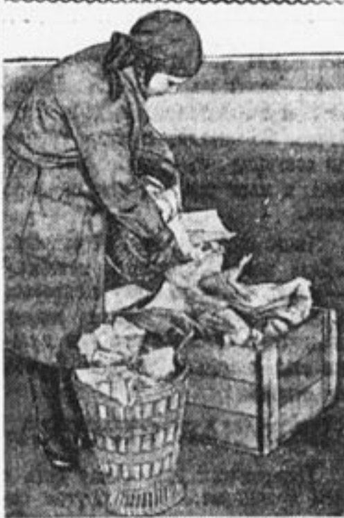
Бумажный хлам — на индустриализацию СССР.

Другой сюрририэ ожидал каждого прогульщика отдельно. Перед их станками были прибиты изготовленные пионерами «позорные плакаты».