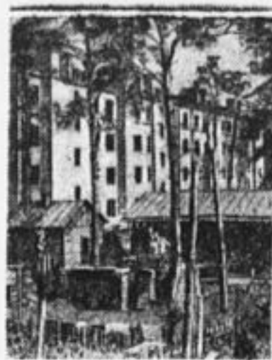
Новые дома для рабочих «Красного Богатыря» (Москва).