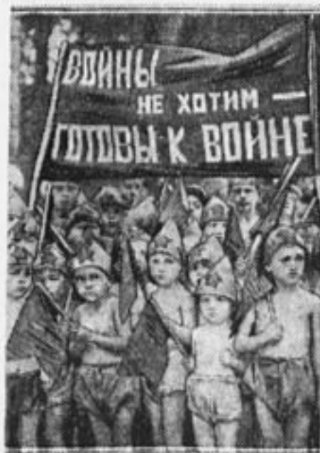
Октябрята на демонстрации 1 августа.