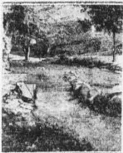
В ауле Богир (Туркменистан) река цементируется, чтобы лучше орошала землю.