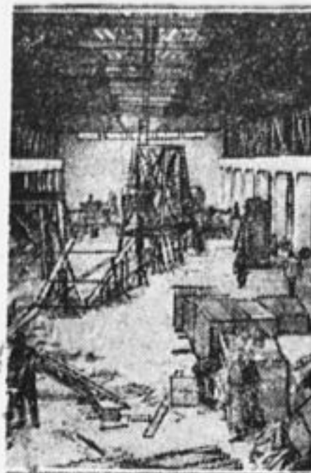
Новый цех на «Сельмашстрое».

Карты, напечатанные здесь, вырежьте и по ним следите за лагерем.