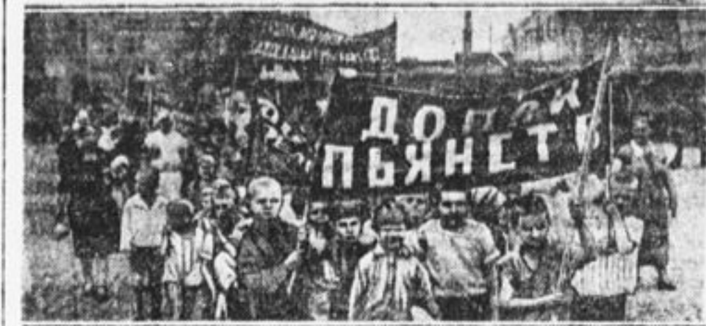
Помни—пьянство спутник неграмотности.

— Пионеры Крайторга собрали деньги и выехали для борьбы с неграмотностью в подшефную