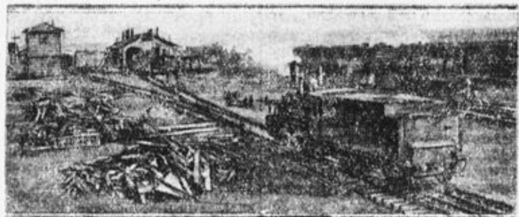
Первая станция Турксиба — Жана-Семей.

Но старые честные труженики не поверили этим бредням, а крикнули в один голос, залпом