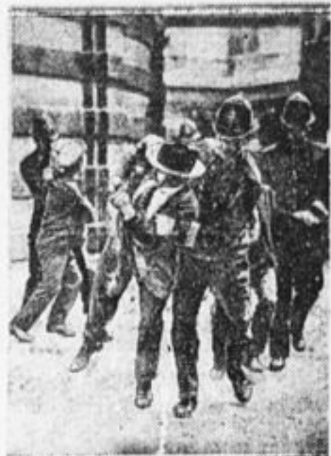
Полицейские арестуют демонстранта.

Быстро же Макдональд забывает свои обещания рабочим! Ныне же Макдональд повторяет, как по указке, политику Болдуина и Чемберлена. Он ищет оттяжек, надеясь во время переговоров поставить нам невыполнимые условия.