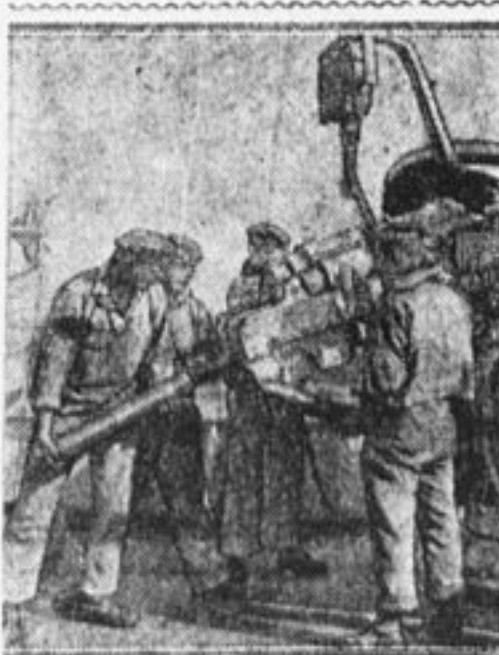
Краснофлотцы на маневрах.

Еще днем, как всегда звенели трамваи, гудели автомобили, грохотали повозки, толпы народа заполняли улицы бурлящим потоком, — ничто еще не говорило о демонстрации. Только красные флаги реяли у каждого дома. К 4-м часам дня на заводах и фабриках долго и протяжно завывали гудки, созывая всех рабочих в боевые колонны. Вот появился первый отряд рабочих, из другой улицы вышла вторая группа, за ней третья, четвертая. Одна за другой выходили на улицы расцвеченные флагами, плакатами, фигурами колонны трудящихся Москвы.