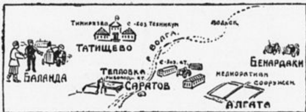
Карта № 2. Что увидит сельскохозяйственная группа.

их край будет через пять лет. И не только посмотреть, но и рассказать всем ребятам края о том, чем пионеры и школьники могут помочь выполнению пятилетнего плана великих работ.